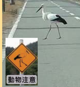
▲道路を横断するJ0097と2021年に交通事故が発生した現場に設置された標識