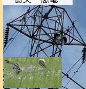
▲鉄塔に衝突し引っかかったJ0097と電線に衝突して水田に落下したJ0318