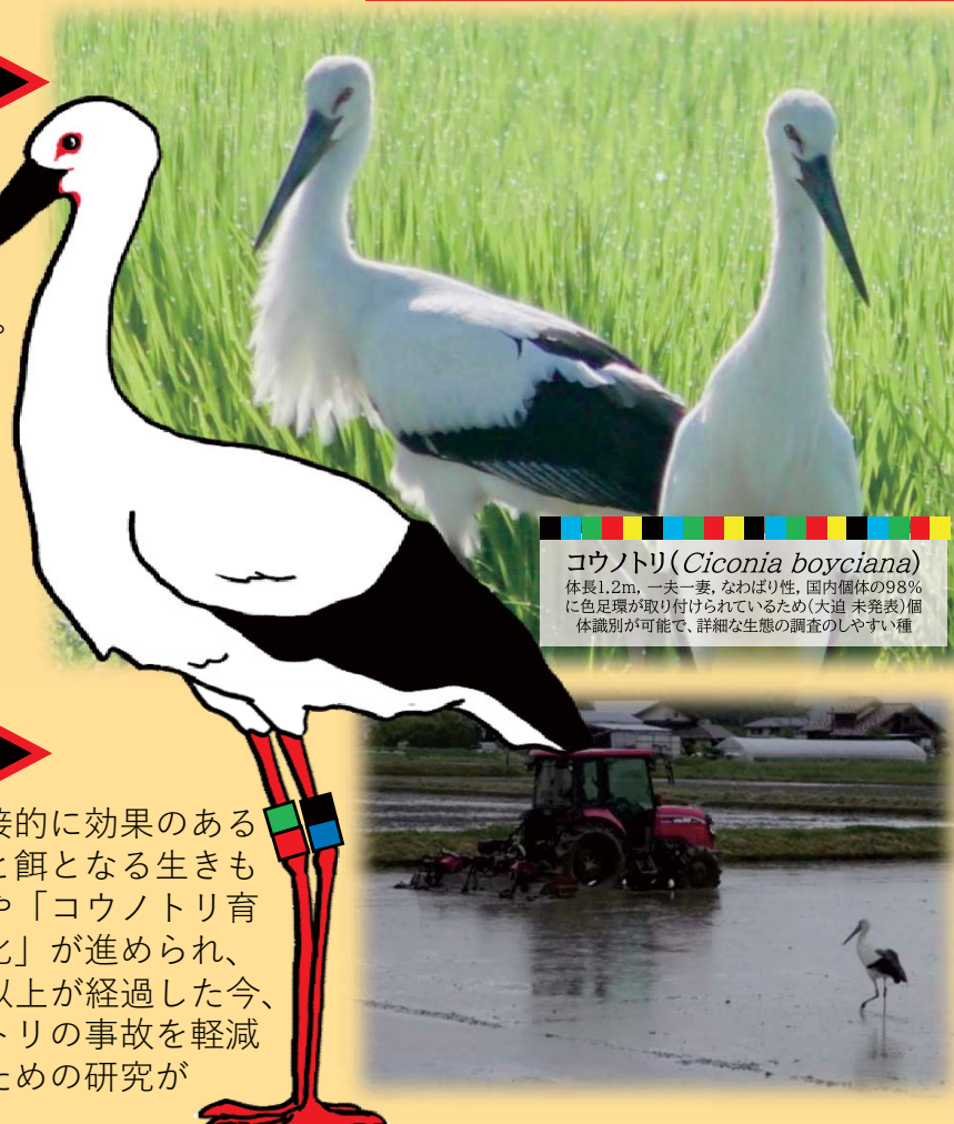
コウノトリ( Ciconia boyciana ) 体長1.2m, 一夫一妻, なわばり性, 国内個体の98%に色足環が取り付けられているため(大迫 未発表) 個体識別が可能で、詳細な生態の調査のしやすい種